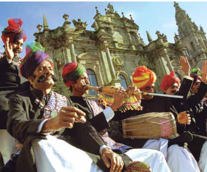
Fomentar la diversidad cultural y la convivencia ciudadana es uno de los objetivos de la Estrategia y, por tanto, del convenio suscrito.

El desarrollo de las acciones previstas en el convenio tendrán en cuenta la diversidad cultural y lingüística del Estado español y tratarán, al mismo tiempo, de mejorar el equilibrio territorial en el acceso a la cultura, tales como los destinados a la conmemoración de efemérides de relevancia cultural, los que tengan por objeto ampliar la difusión de los promovidos con este fin a otros territorios o la creación de rutas culturales, entre otros. ★