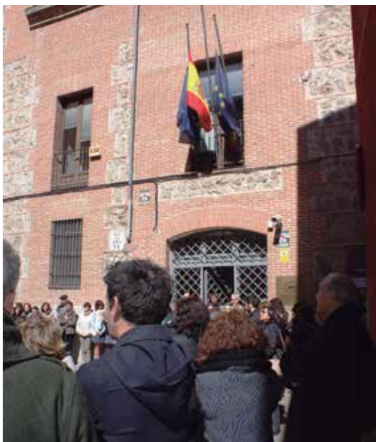
La plantilla de la FEMP durante el minuto de silencio.

La FEMP se unió al luto oficial decretado por el Gobierno por los fallecidos en el accidente aéreo de los Alpes e hizo un llamamiento a las Entidades Locales españolas para que se sumaran a las tres jornadas de duelo que dieron comienzo a las 0 horas del 25 de marzo, colocando sus banderas a media asta durante ese tiempo.