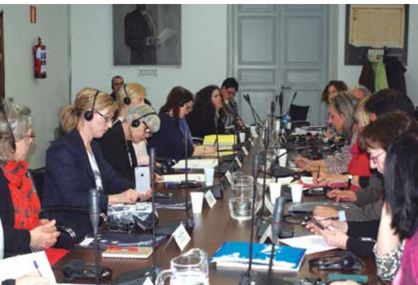
La FEMP fue el escenario de varias reuniones de seguimiento del proyecto.

No obstante, Liss Shanke considera que lo importante para la gente que trabaja dentro de los municipios, lo esencial, es cómo se pueden dar los mejores servicios para los habitantes. "Y este reto es común para todos los municipios, aunque las soluciones puedan o no ser diferentes" .