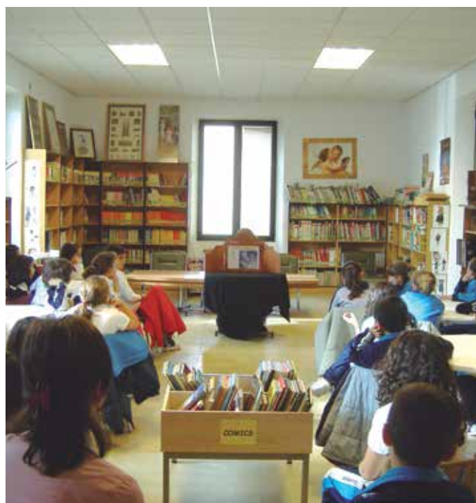
La FEMP quiere que se reconozca el inestimable papel de las bibliotecas municipales en el fomento de la lectura.

Desde la Federación se alude, además, a la participación de estos centros en las Campañas de Animación a la Lectura María Moliner que, en su última edición, concitó 609 proyectos elaborados y rea-