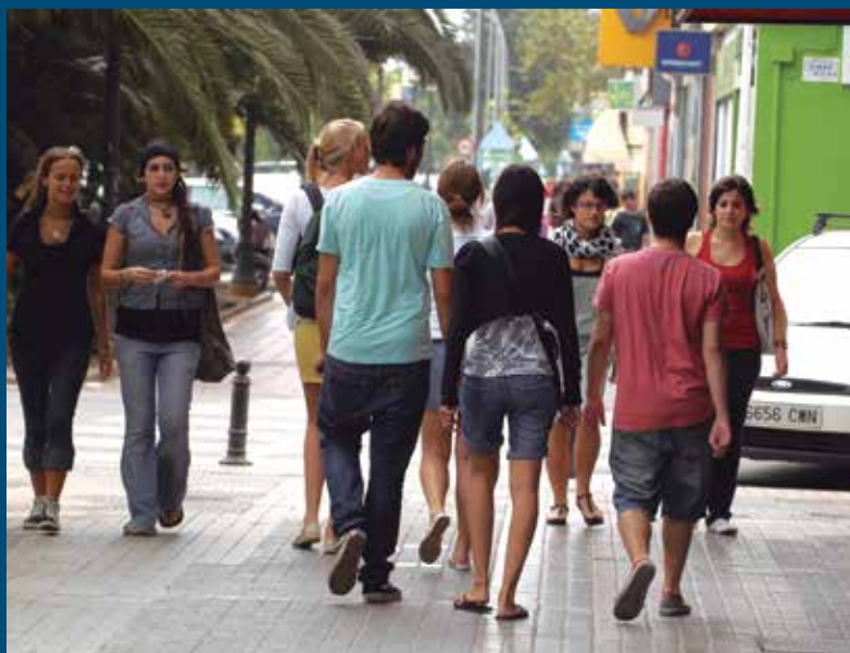
Una nueva prórroga al convenio con el INJUVE permitirá seguir desarrollando programas locales dirigidos a los jóvenes.

Será igualmente posible desarrollar programas locales dirigidos a los jóvenes (mediante la prórroga para 2015 del acuerdo FEMP-INJUVE) y continuar impulsando el consumo responsable de bebidas sin alcohol en el marco de la campaña "En la carretera, cerveza sin", que se viene desarrollando al amparo del convenio entre la FEMP y la Asociación de Cerveceros de España (ACE).