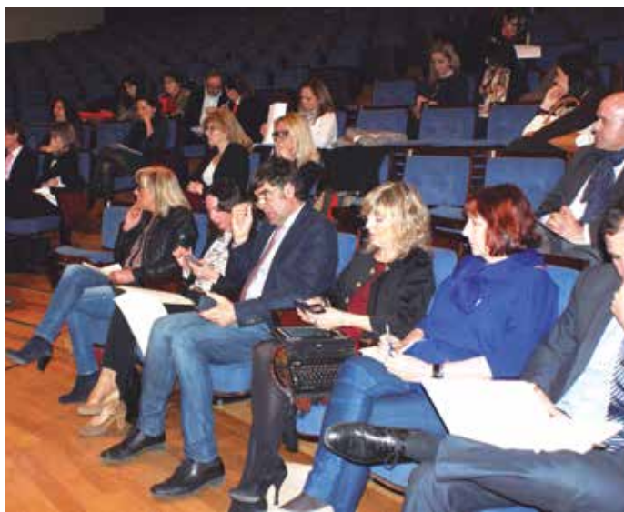
Al encuentro acudieron cerca de un centenar de profesionales del sector del turismo de reuniones (MICE).

También argumentó que el turismo de negocios da mucha riqueza al país y que "España debe mucho a las ciudades que invierten en