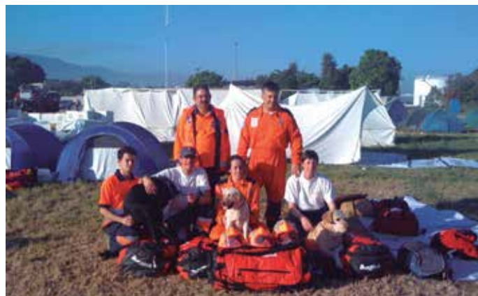
La nueva Ley incorpora aspectos no regulados hasta ahora, como el voluntariado internacional.

En cuanto a los derechos y deberes de los voluntarios, y esto es una novedad, se garantiza la igualdad en el acceso al voluntariado de las personas en situación de dependencia en los formatos adecuados y en las condiciones acordes a sus circunstancias personales, algo que en el Anteproyecto de Ley figuraba para las personas con discapacidad y las personas mayores. Además, se fija en doce años la edad mínima para que participen menores en proyectos.