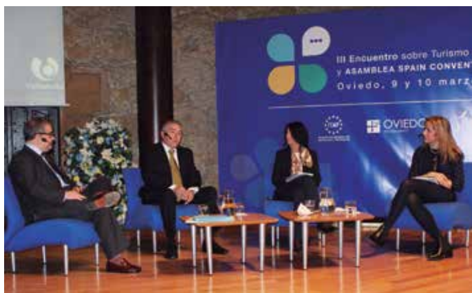
Una de las mesas de debate de la reunión de Oviedo.

turismo de reuniones", en concreto a las que integran el SCB, "que van a seguir trabajando decididamente para que sigamos siendo un destino puntero en el mundo".