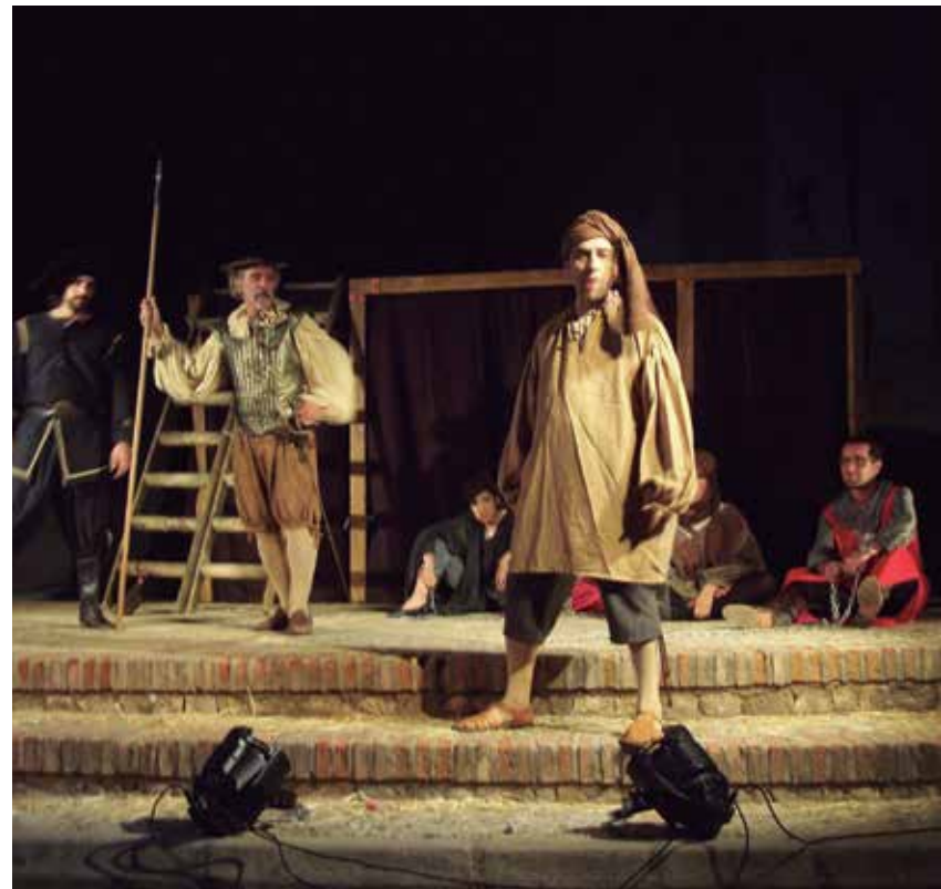
El objetivo del convenio es enriquecer la programación cultural en los municipios.

Para la difusión de la programación teatral, se contará con los medios y herramientas informativas con las que cuenta la FEMP. Escenamateur colaborará con las Entidades Locales en las acciones en que éstas cuenten con grupos de teatro aficionado asociados a la Confederación para la óptima realización de las mismas. ★