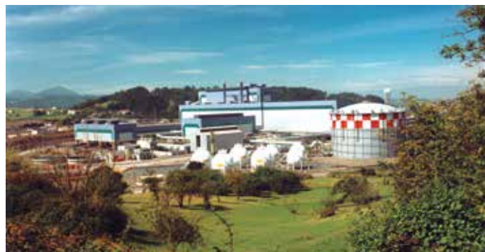
Se han planteado medidas para facilitar el cumplimiento de las obligaciones tributarias de las distribuidoras y comercializadoras de gas

En la exposición de motivos se añade que en relación con los rendimientos derivados de las figuras tributarias establecidas se deberán adoptar los criterios oportunos para que los mismos reviertan con especial intensidad