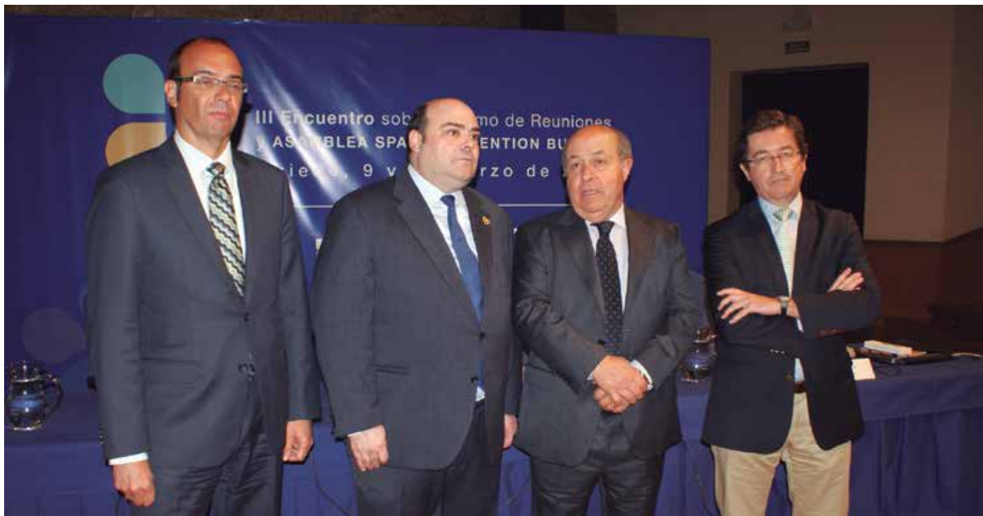
Los Alcaldes de Oviedo y Granada, en el centro, con el Subdirector Adjunto de Desarrollo y Sostenibilidad de la Secretaría de Estado de Turismo y el Secretario General de la FEMP, en la inauguración del encuentro.

En este ámbito de actuación, el Alcalde de Granada recordó, al respecto, la firma el pasado año en esa ciudad de un Convenio con la Marca España, “que nos permite colaborar con ellos en difundir los importantes activos que proyecta nuestro país en los mercados internacionales” .