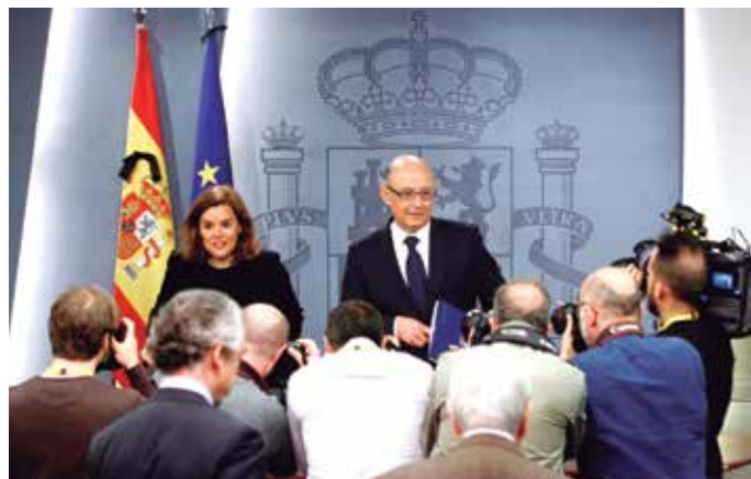
El Ministro Montoro dio los últimos datos de déficit público en el Consejo de Ministros del 27 de marzo.

Con los resultados obtenidos, el sector local español mantiene la tendencia de reducción que ya inició en ejercicios anteriores. También mantienen su tendencia, aunque en sentido contrario, las Administraciones Autonómica y Central del Estado. La primera ha subido 4 décimas en el PIB (con unos valores de 236.747 millones de euros) y la segunda se mantiene en el mismo porcentaje sobre PIB, aunque ha crecido en casi 4.000 millones de euros para situarse en 895.852 millones. ★