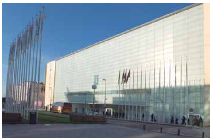
Palacio Municipal de Congresos de Madrid.

En cuanto al desarrollo del mismo, el Reglamento recoge el procedimiento de constitución de la Mesa así como las atribuciones y responsabilidades de ésta. El Pleno desarrollará sus funciones a través de las reuniones del Plenario y de las Comisiones de Trabajo que se constituyan en su caso para el debate sectorial de los asuntos incluidos en el Orden del Día correspondiente. Cada socio titular de la FEMP podrá solicitar su participación en las Comisiones de Trabajo que desee, comunicándolo oportunamente a la Secretaría General. No obstante, por razones técnicas podrá limitarse el número de participantes en cada Comisión. En ambos casos, la Junta de Gobierno establecerá el plazo y procedimiento de opción, que será remitido a los socios junto a la convocatoria del Pleno.