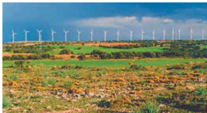
Los proyectos que se presenten tendrán que estar centrados en aspectos ambientales y energéticos.

Otro de los principales objetivos específicos será aumentar el uso de las energías renovables para producción de electricidad y usos térmicos en edificación y en infraestructuras públicas, en particular favoreciendo la generación a pequeña escala en puntos cercanos al consumo.