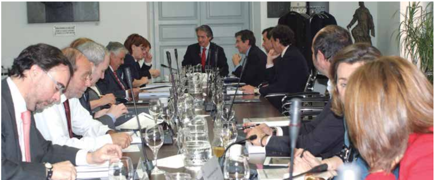
La última Junta de Gobierno ordinaria se celebró el 24 de marzo

Con todo ello, los participantes en el Pleno podrán serlo en calidad de delegados, observadores afiliados y observadores no afiliados. Los primeros acuden con voz y voto en representación de socios titulares. Los segundos, con voz pero sin voto, son miembros de Entidades Locales asociadas a la FEMP o también representantes de Federaciones Territoriales de Entidades Locales de ámbito autonómico asociadas a la FEMP. En cuanto a los terceros, que no tienen voz ni voto, son aquéllos que representan a Corporaciones Locales no asociadas, o de Federaciones de Entidades Locales de ámbito autonómico no vinculadas a la FEMP. ★