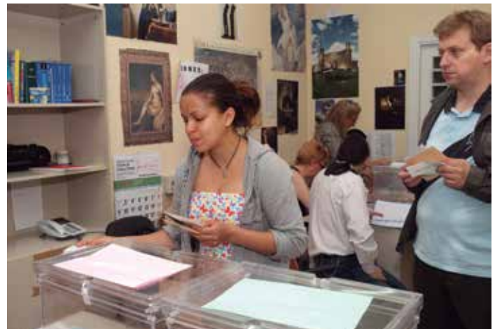
En estas elecciones podrán votar 463.765 extranjeros que residen en nuestro país.

bleas de las Ciudades Autónomas de Ceuta y Melilla. Los países con más españoles inscritos en el censo para esta convocatoria son Argentina (147.442), Francia (105.109), Venezuela (99.281) y Cuba (72.149).